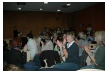
Interessierte Teilnehmer/innen der Fachtagung beim „Marktplatz“ und bei der Eröffnung der Fachtagung

Den Abschluss der Tagung bildeten aktuelle Informationen zur Zukunft des Projektes