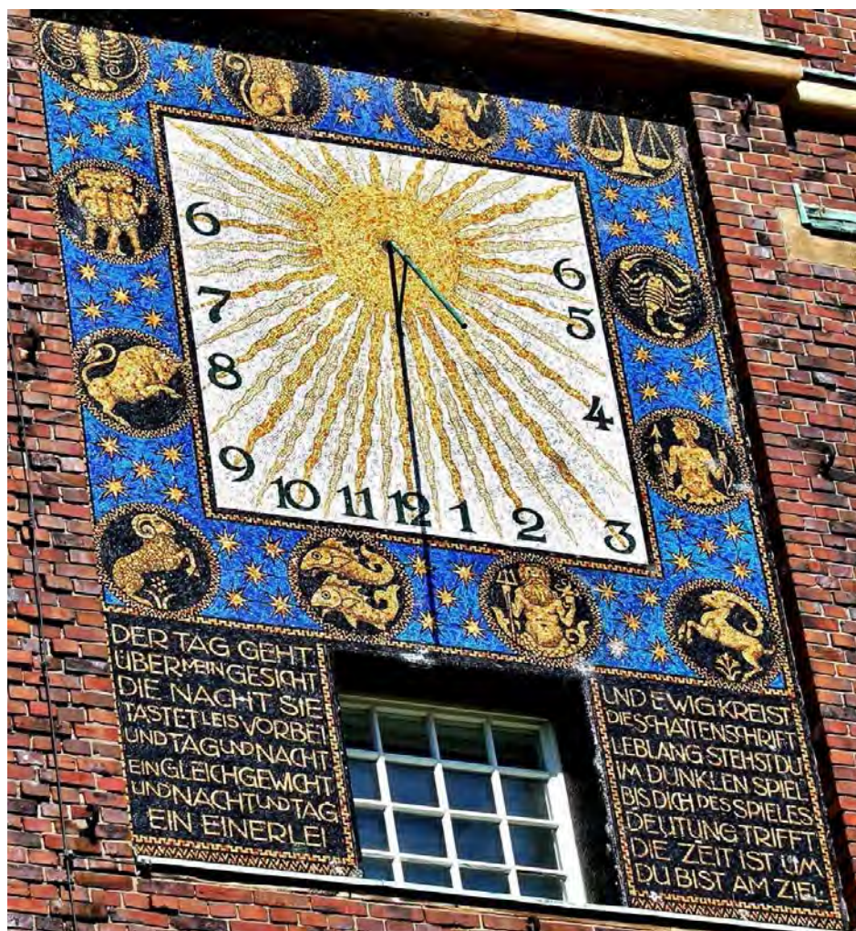
Sonnenuhr am Hochzeitsturm in Darmstadt

Für das Jahr 2024 wünschen wir Euch und Ihnen, liebe Leserinnen und Leser, Gesundheit und Zuversicht und allen Menschen auf unserem Planeten etwas mehr Frieden mit sich und anderen.