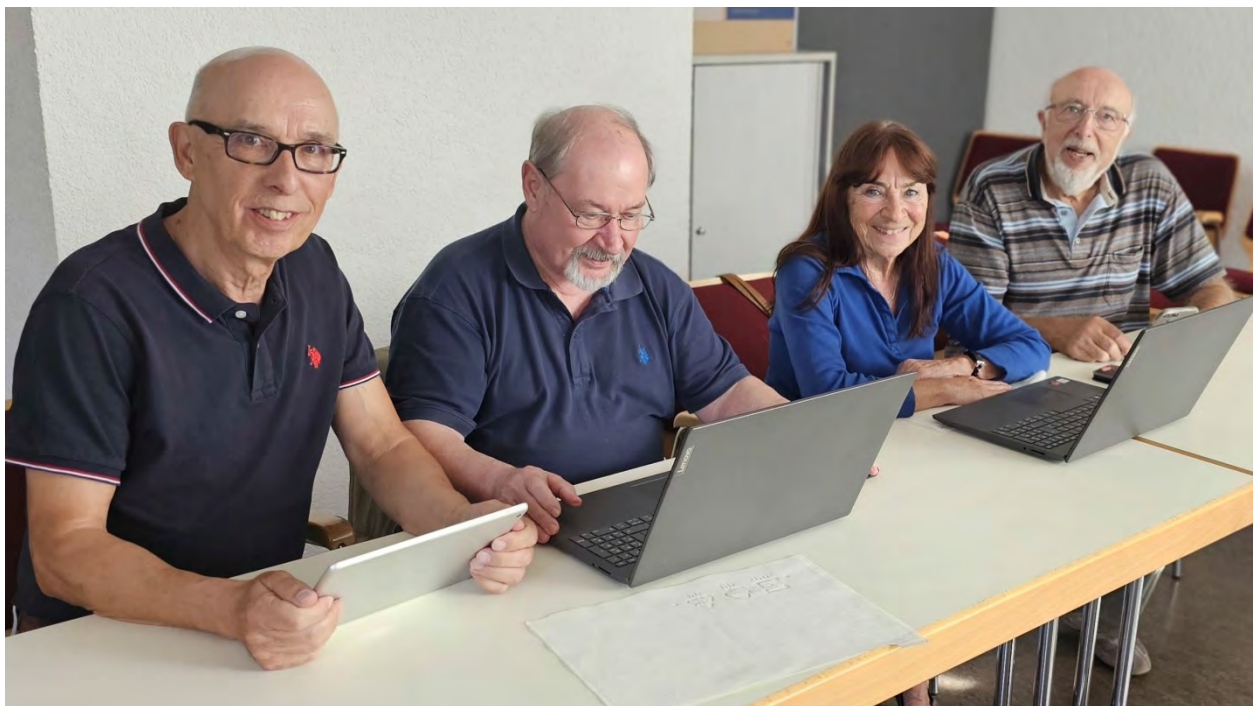
Ihr Team vom Digitaltreff Weiterstadt

Der Digitaltreff in der Kernstadt im Seniorentreff, Carl-Ulrich-Str. 9-11, donnerstags von 14-16 Uhr und auch freitags nach Anmeldung im Seniorenbüro (06150-4001015) von 10 – 12 Uhr bleibt nach wie vor als wichtigster Pfeiler des Hilfsangebots bestehen. Freitags findet unter anderem auch die Übergabe der Tablets statt, die man für 4 Wochen einmal zum Ausprobieren gratis ausleihen kann.