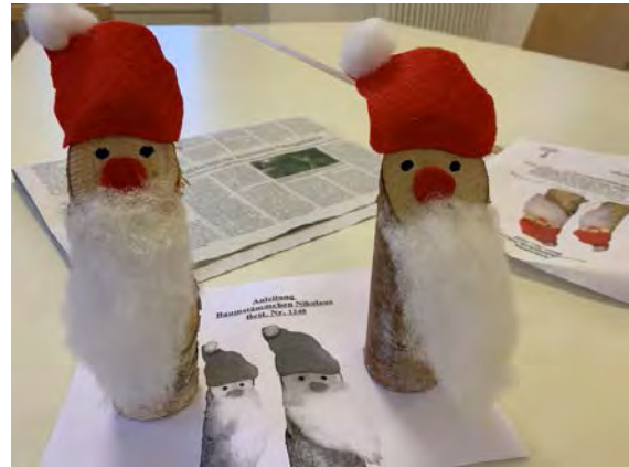
Im November wurde für Weihnachten gebastelt

Für den letzten Dienstag im Monat gibt es immer ein Themen-Angebot mit der Dauer von 30-60 Minuten.