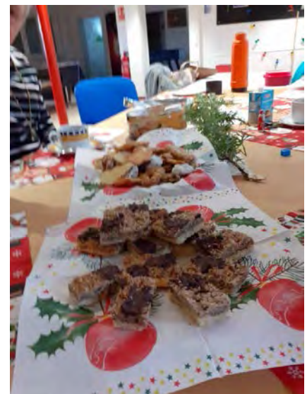
Zum Jahresabschluss wurde genascht

Also, liebe Seniorinnen und Senioren, es sind noch Stühle frei. Die Plauderstunde findet bis auf ganz wenige Ausnahmen, dienstags ab 10.30 Uhr im Juze (Arheilger Straße) statt.