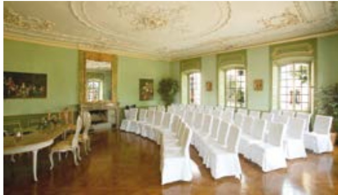
Der Grüne Saal als Trauzimmer

Für Ihre Trauung stehen Ihnen sowohl der Grüne Saal des Schlosses (max. 50 Personen) als auch in der wärmeren Jahreszeit die kleine Hochzeitskapelle (max. 16 Personen) im Park zur Verfügung. Darüber hinaus bietet sich in Kombination mit dem neu erbauten Bürgerhaus Braunschardt (fußläufig leicht erreichbar) die Möglichkeit, Tagungen und Großveranstaltungen durchführen zu können.