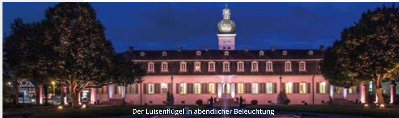
Der Luisenflügel in abendlicher Beleuchtung